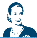
MUJER DEL BICENTENARIO